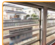
車内換気のため、定期的に窓開けを実施します

車内にアルコール消毒液を設置します 手の触れる機会が多い場所は定期的に拭き取り消毒を実施します 今年はピッチャー対応を行いません